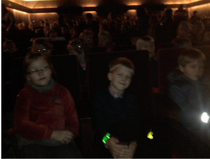
Šiaulių dramos teatro spektaklyje.