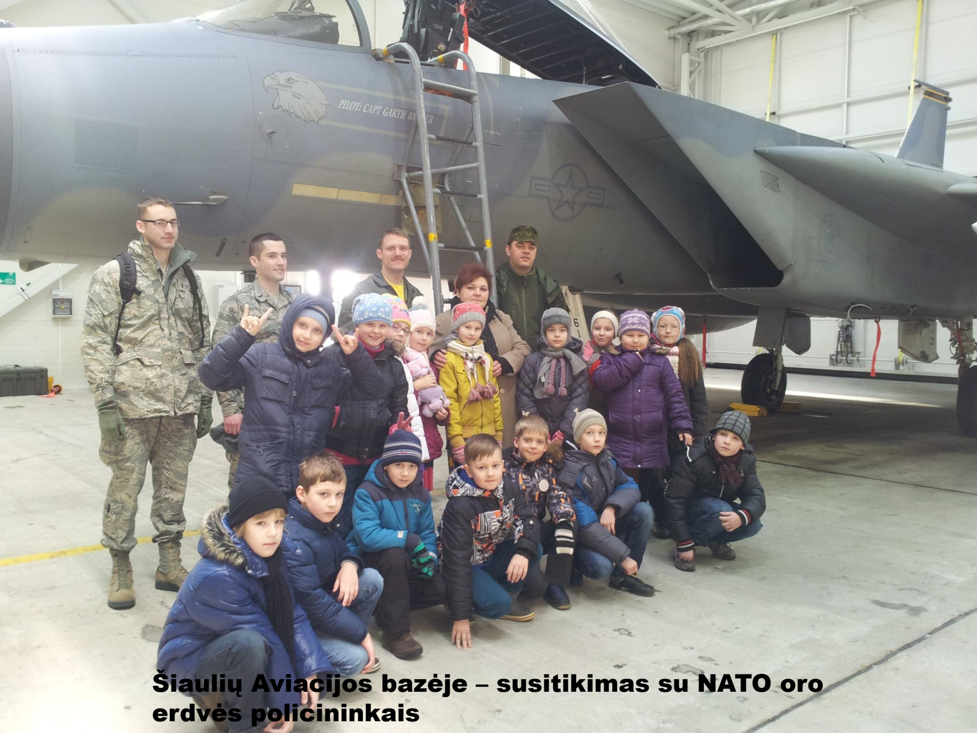
Šiaulių Aviacijos bazėje – susitikimas su NATO oro erdvės policininkais